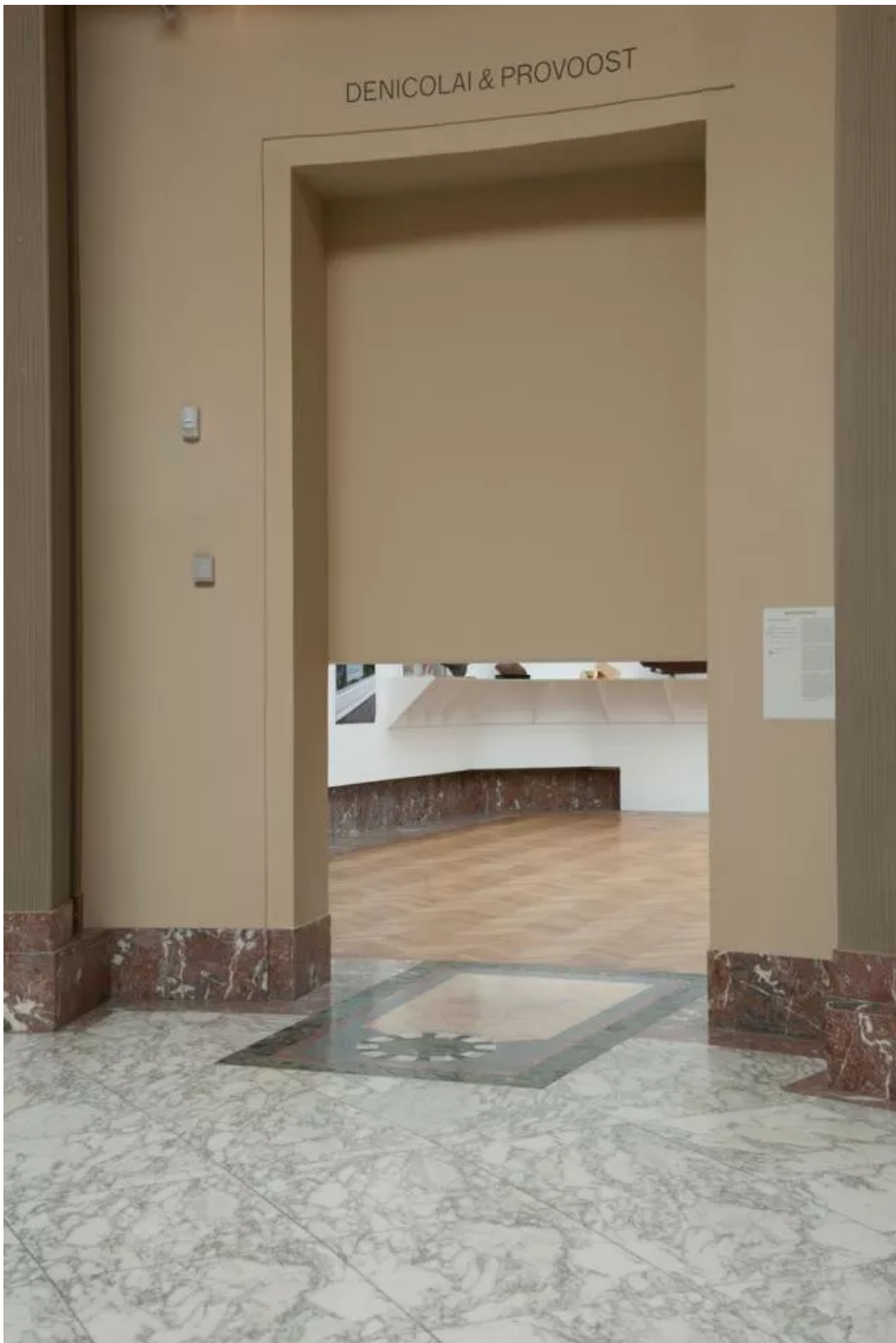
Entrance of the exhibition Eyeliner, Bozar 17/03/17 – 28/05/17, BelgianArtPrize 2017.