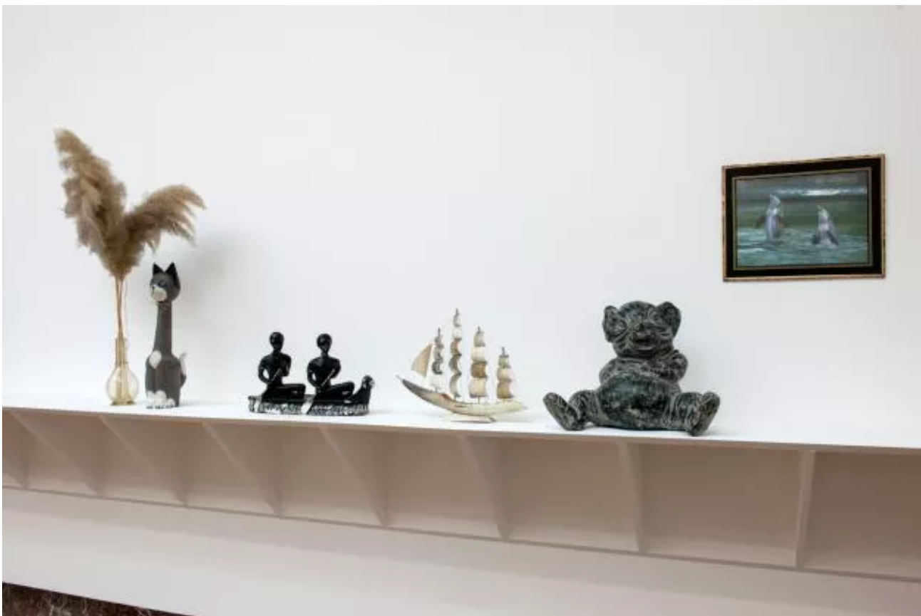
Eyeliner, Installation view.