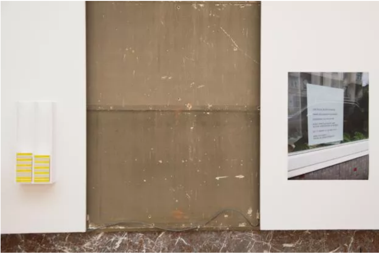
Eyeliner, Installation view.