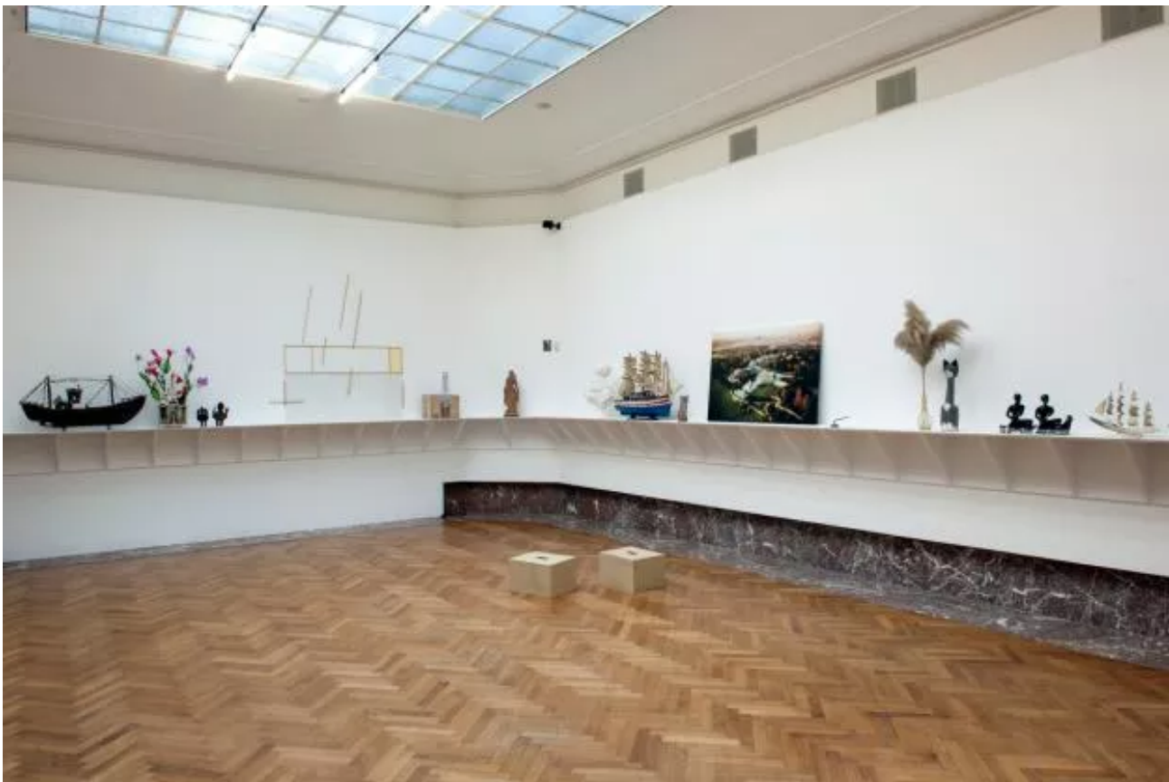
Eyeliner, Installation view. © Philippe De Gobert