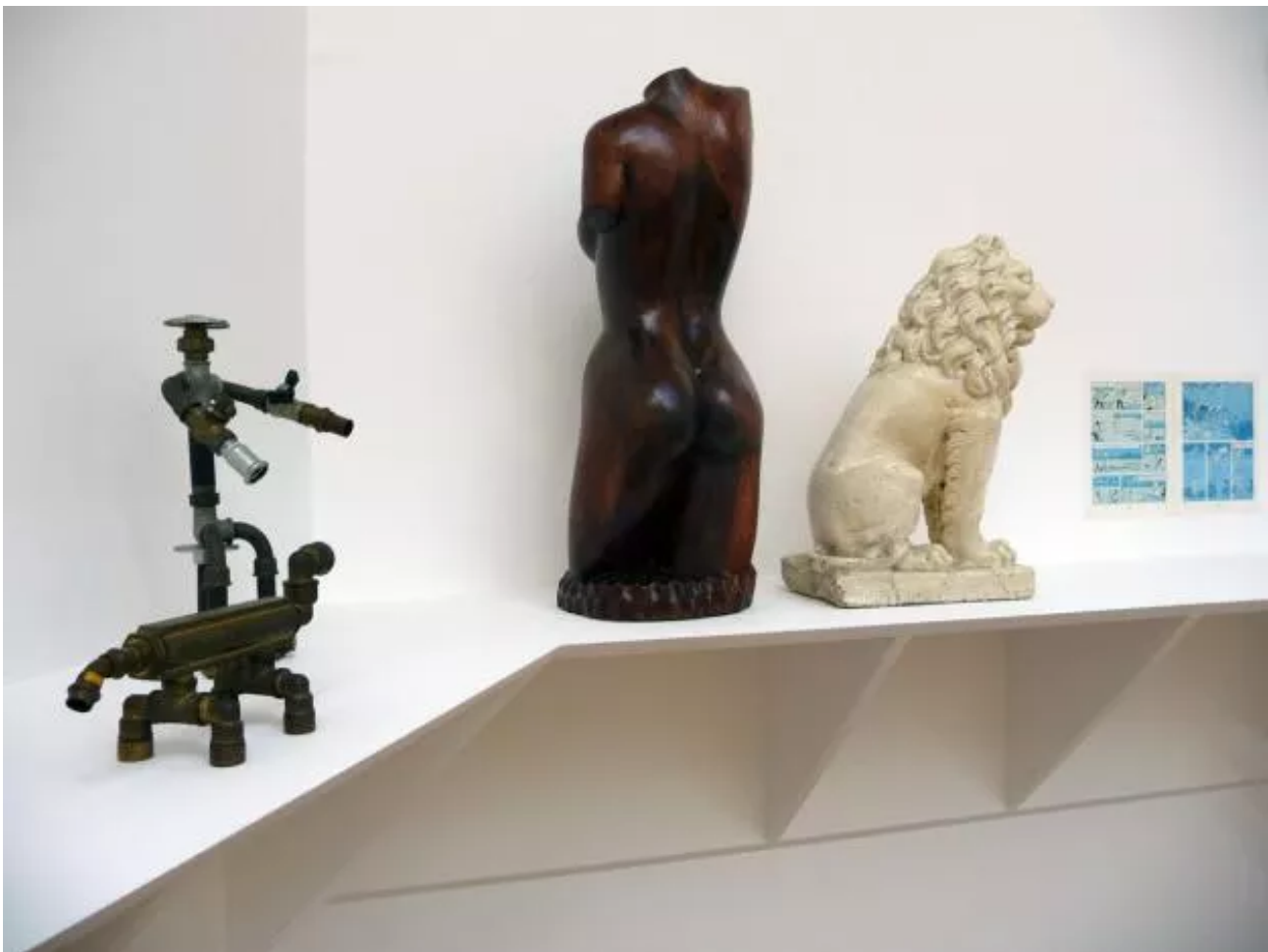
Eyeliner, Installation view.