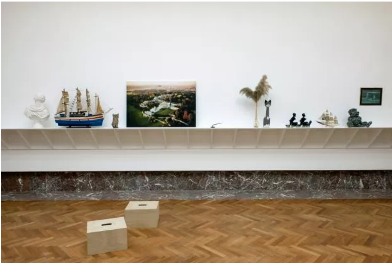
Eyeliner, Installation view.