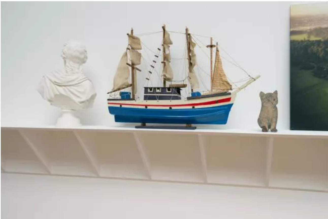
Eyeliner, Installation view.