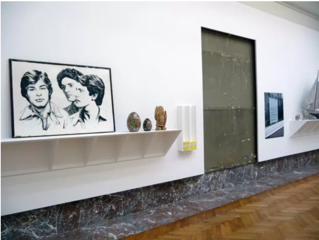
Eyeliner, Installation view.