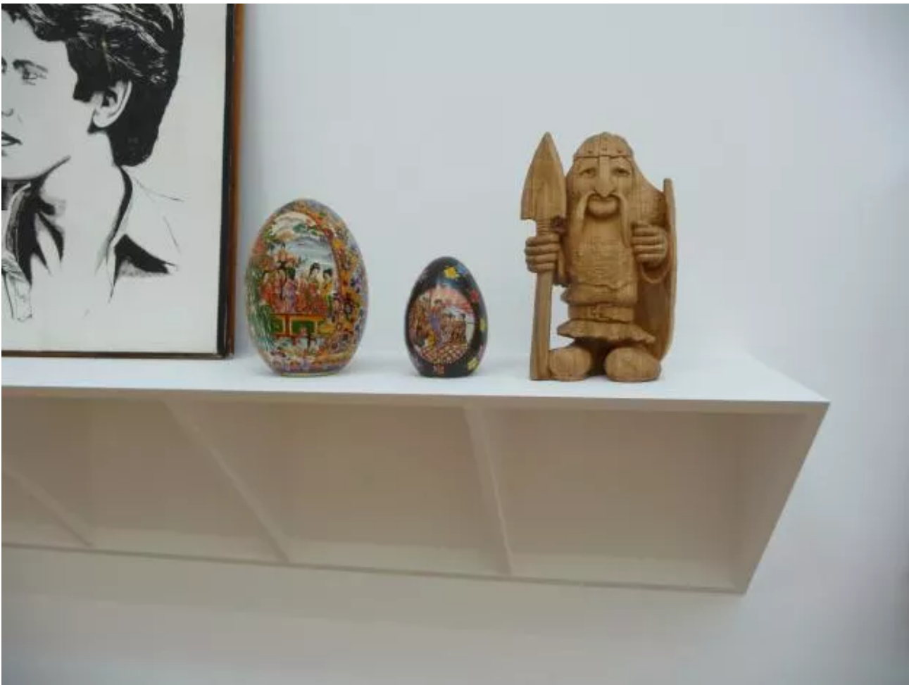
Eyeliner, Installation view.