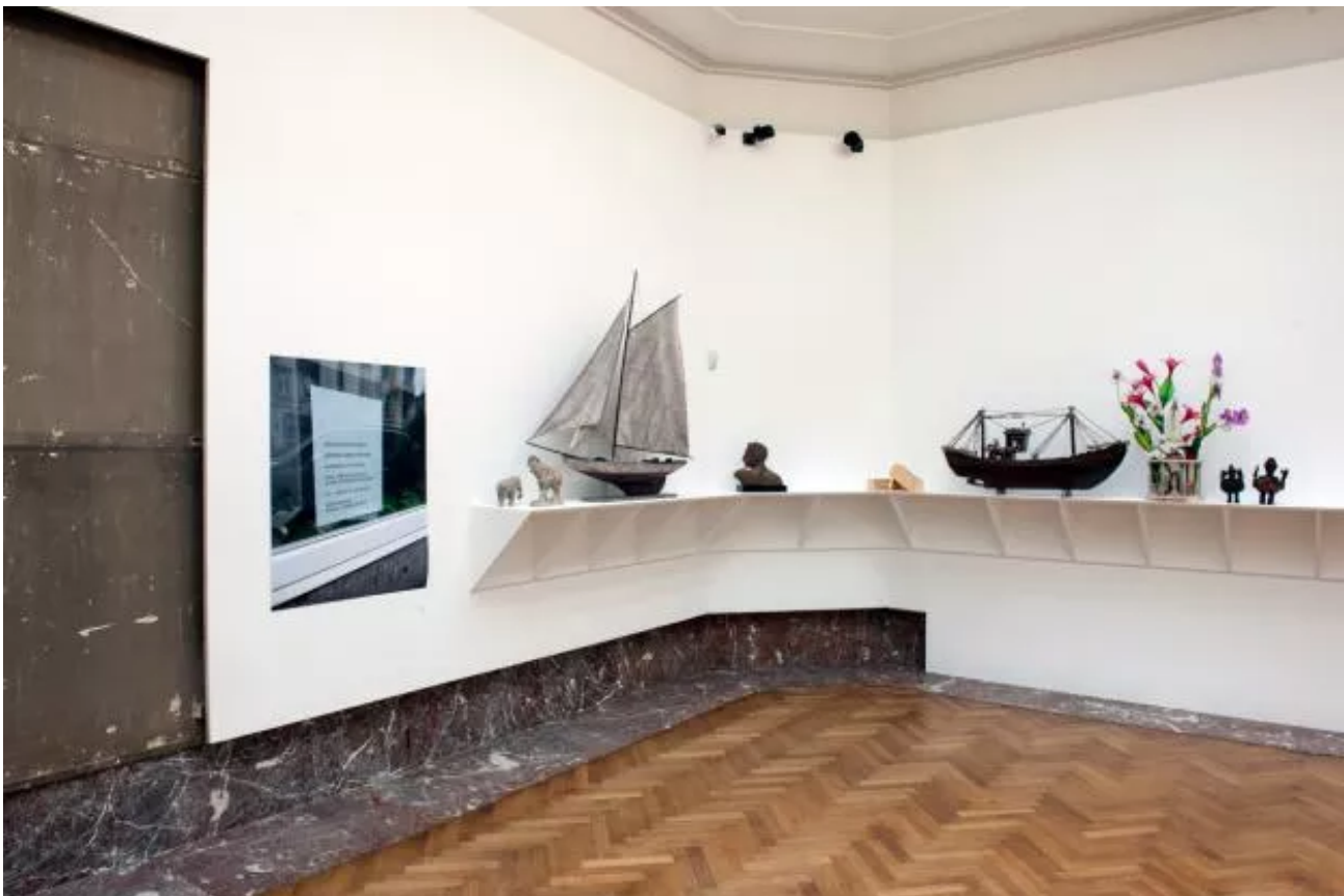
Eyeliner, Installation view. © Philippe De Gobert