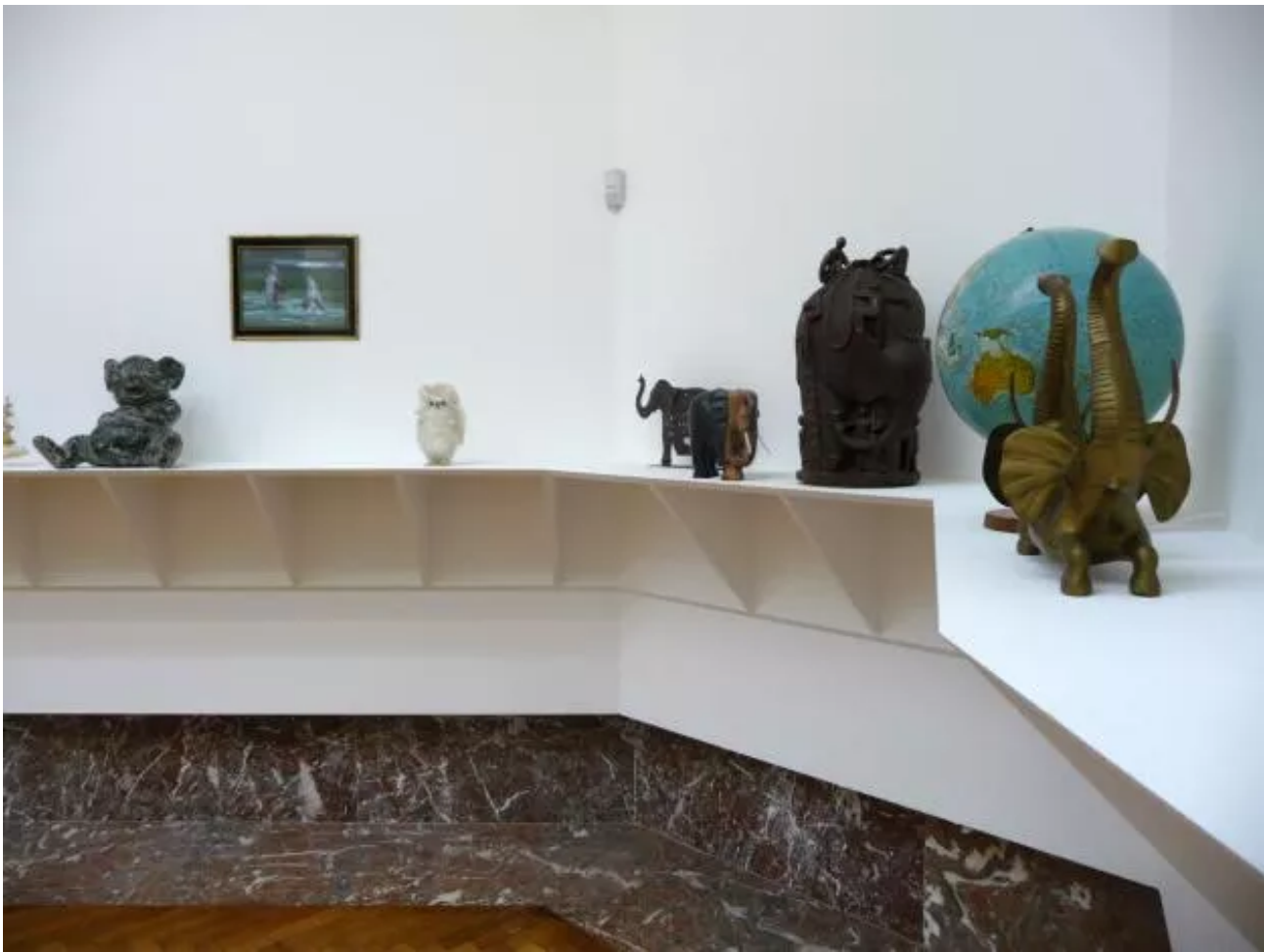
Eyeliner, Installation view.