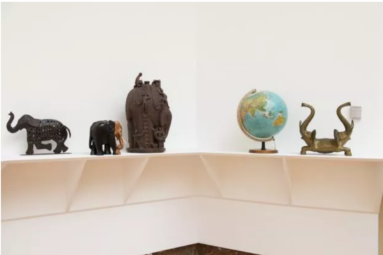
Eyeliner, Installation view.