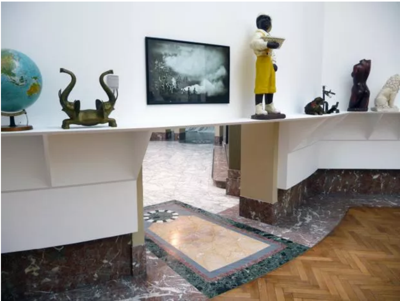
Eyeliner, Installation view.