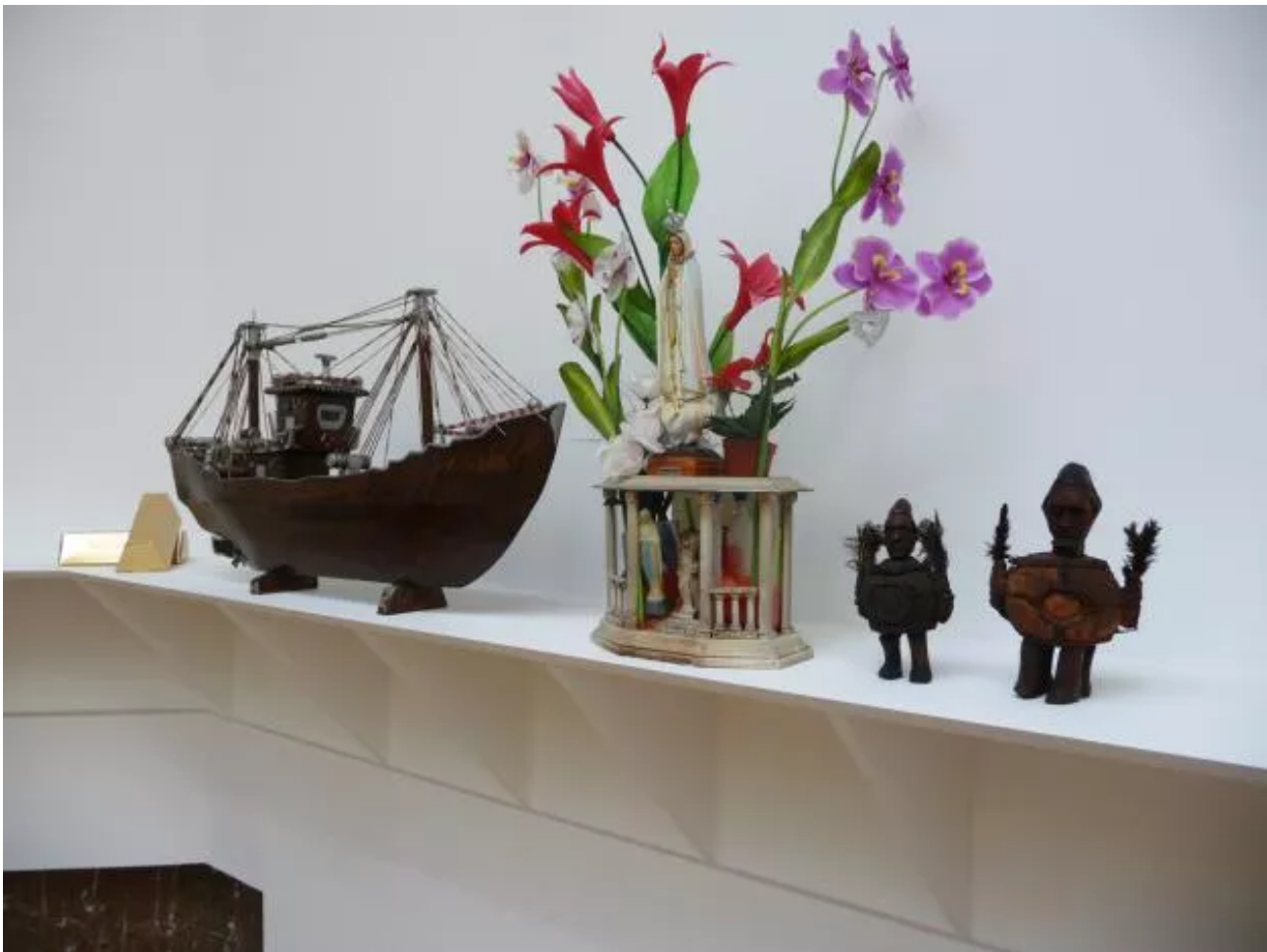
Eyeliner, Installation view.