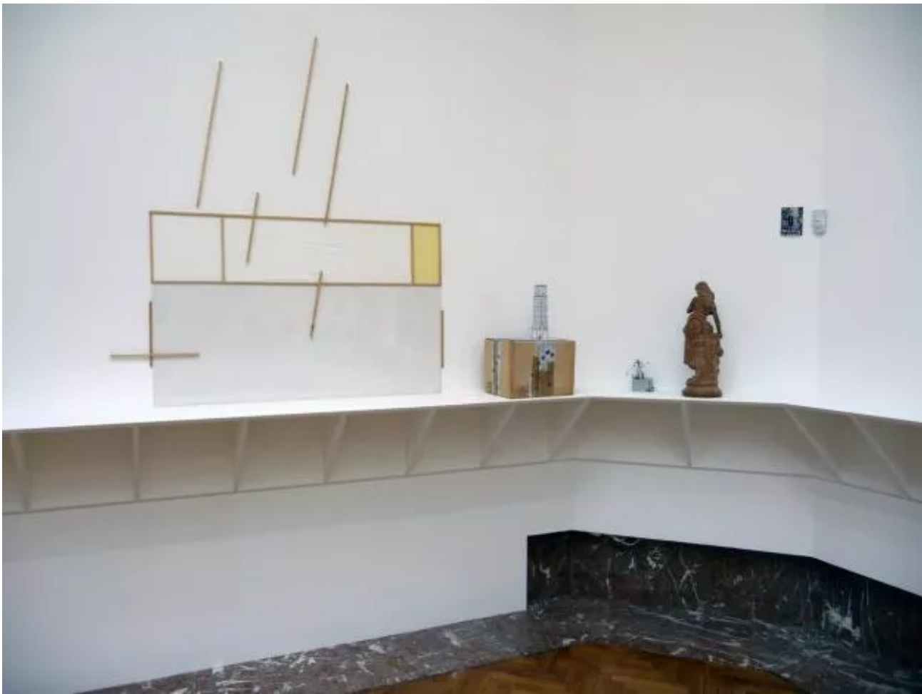
Eyeliner, Installation view.