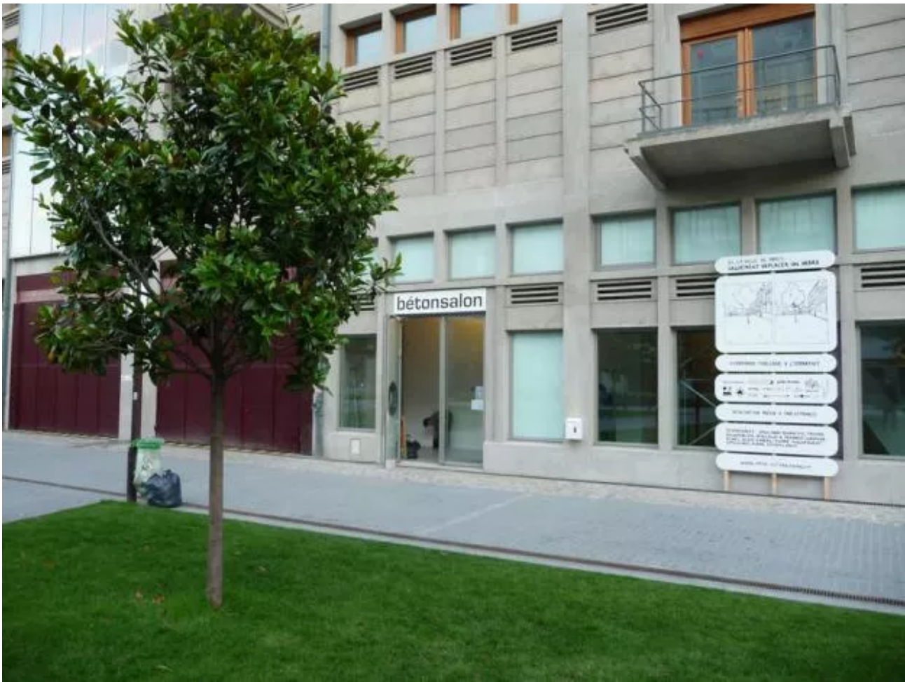
Exhibition view 'Dialogic Park 1', at Bétonsalon, Paris. Curated by Renaud Huberlant & Cedric Libert.