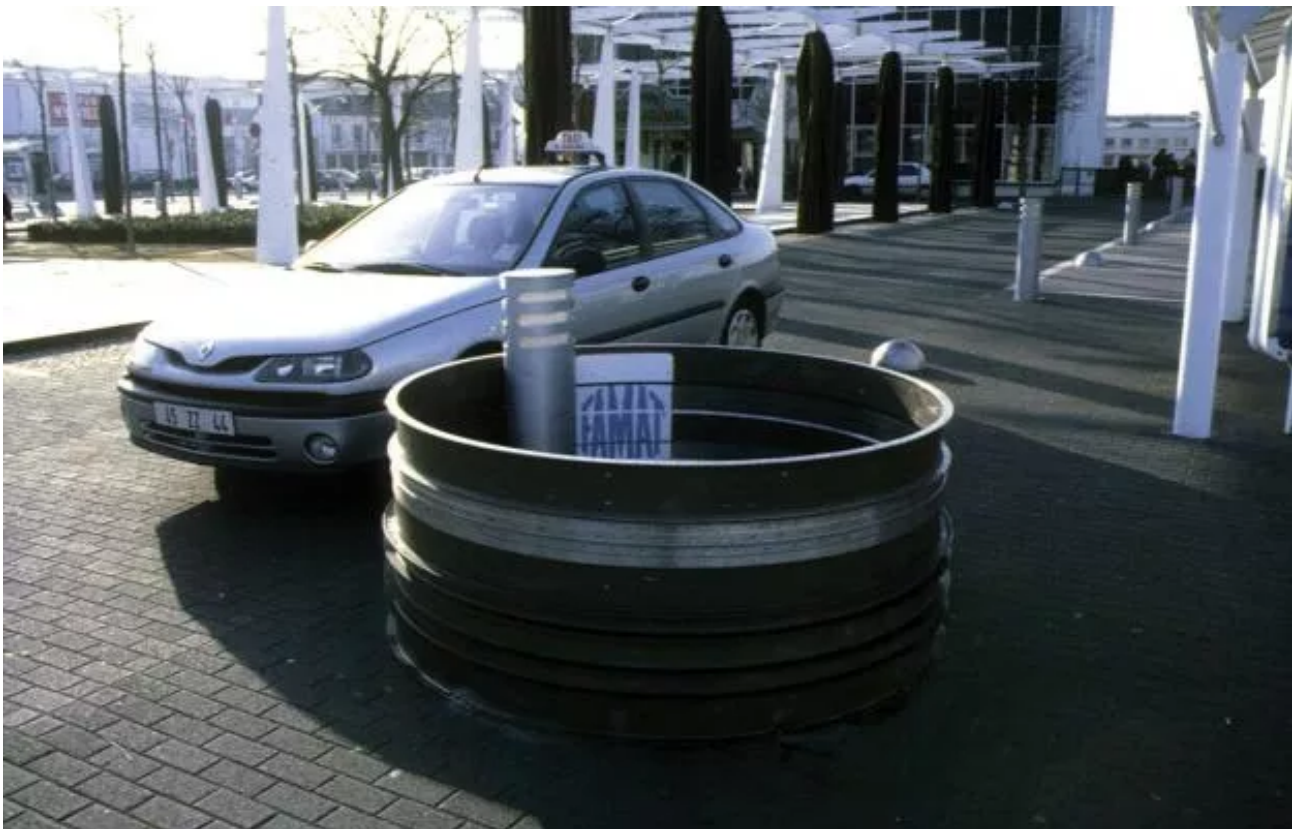
Blowing cell lent by Famat, installed in front of the station, around an urban lighting element.