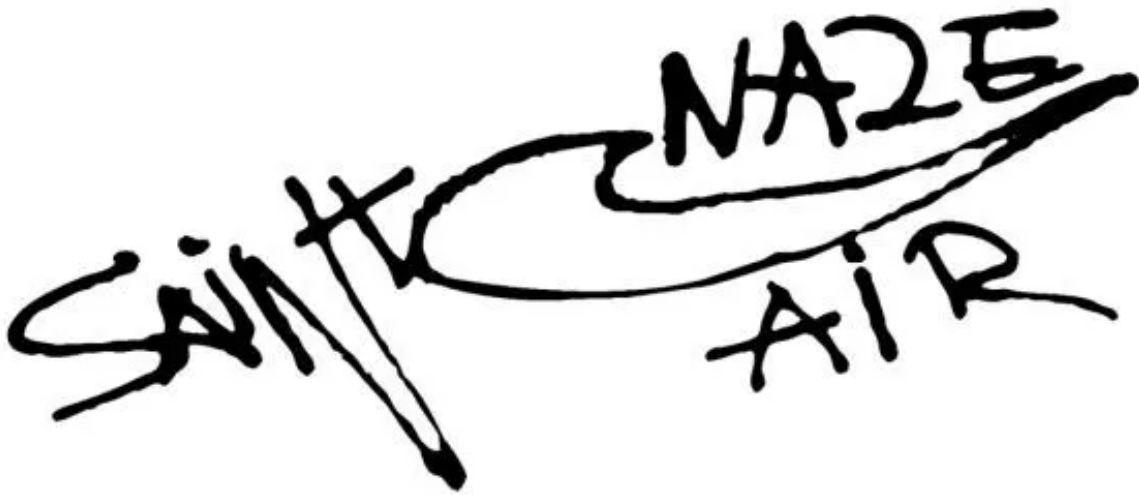
Found graffiti in Saint-Nazaire.