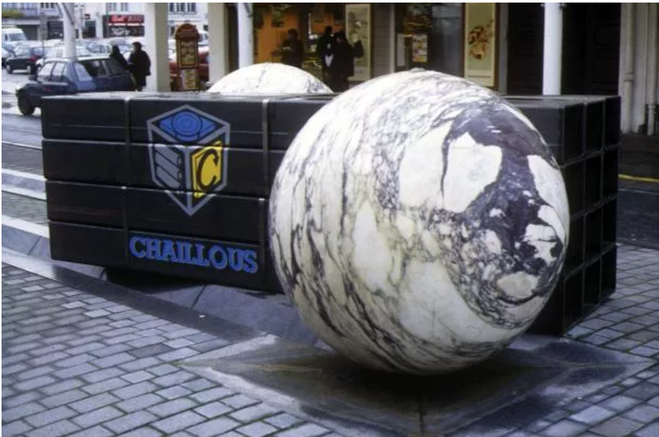
Twelve square black steel tubes lent by Chaillous, installed between two marble balls of an urban fountain.