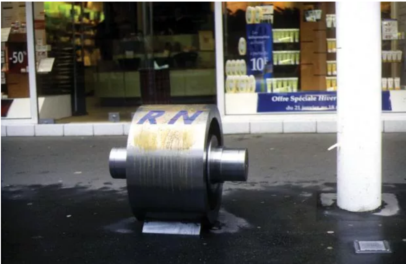
Conveyor roller lent by R2N, installed under a hood in front of a beauty salon.