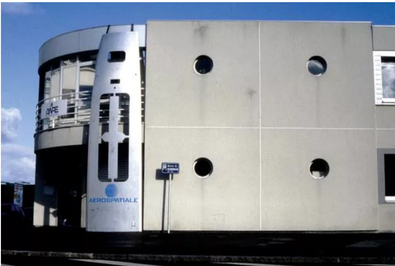
Front fuselage wall board for airbus lent by Aerospatiale, fixed on the frontage of the building of The National Agency for Employment.