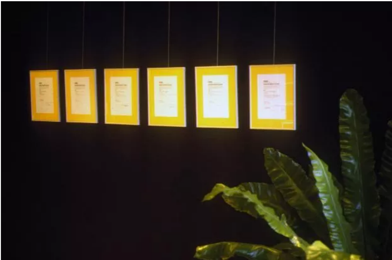
Agreements with the invited sponsors exhibited in the Town hall.