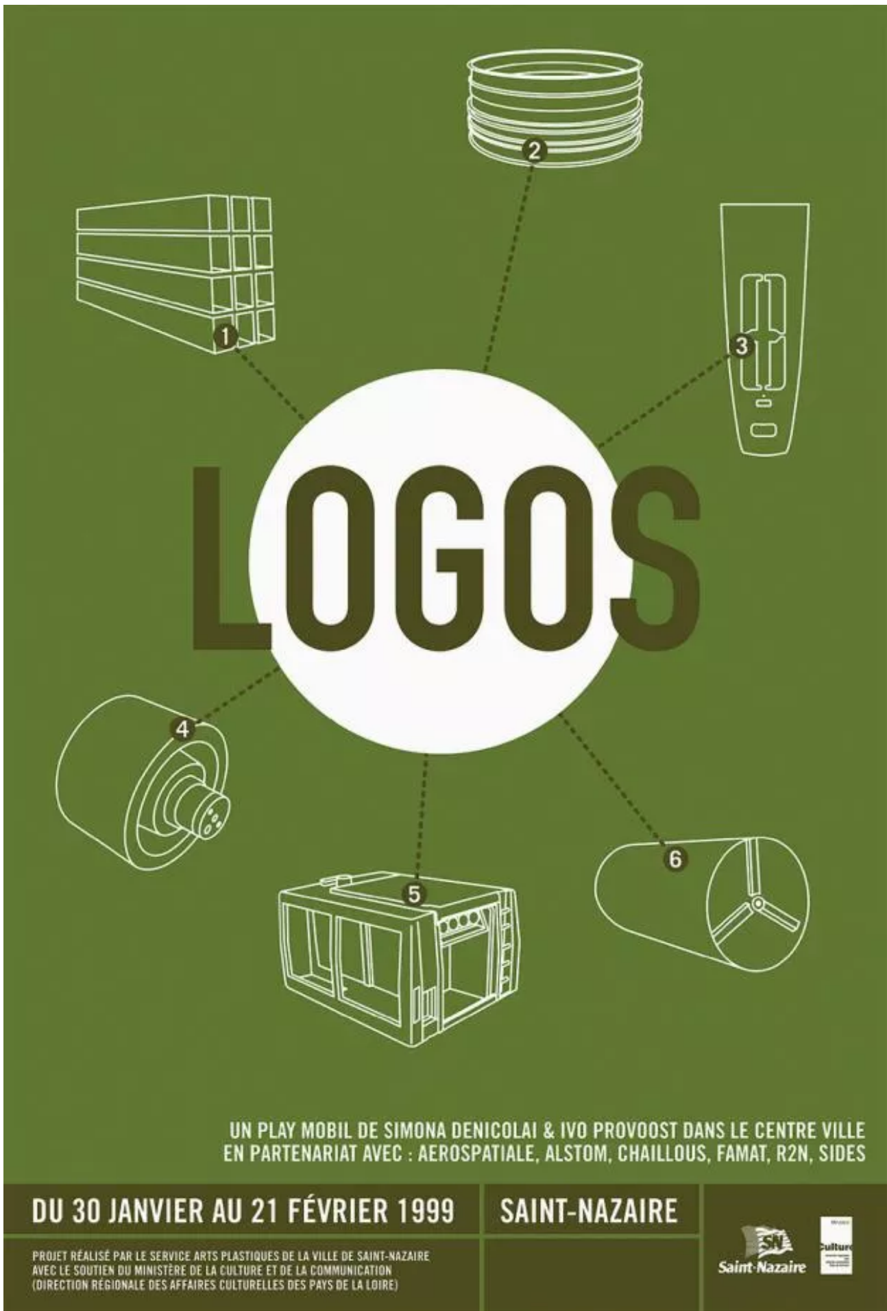
Poster design: Régis Le Bras.