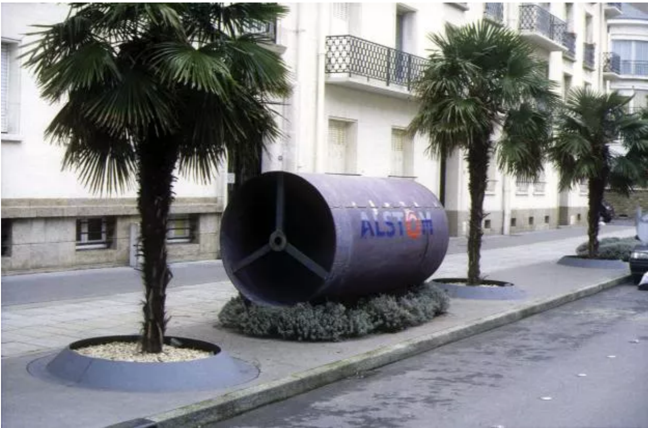
Transmission tube lent by Alstom, installed on a small island of lavender between two palm trees in the rue Général De Gaulle.