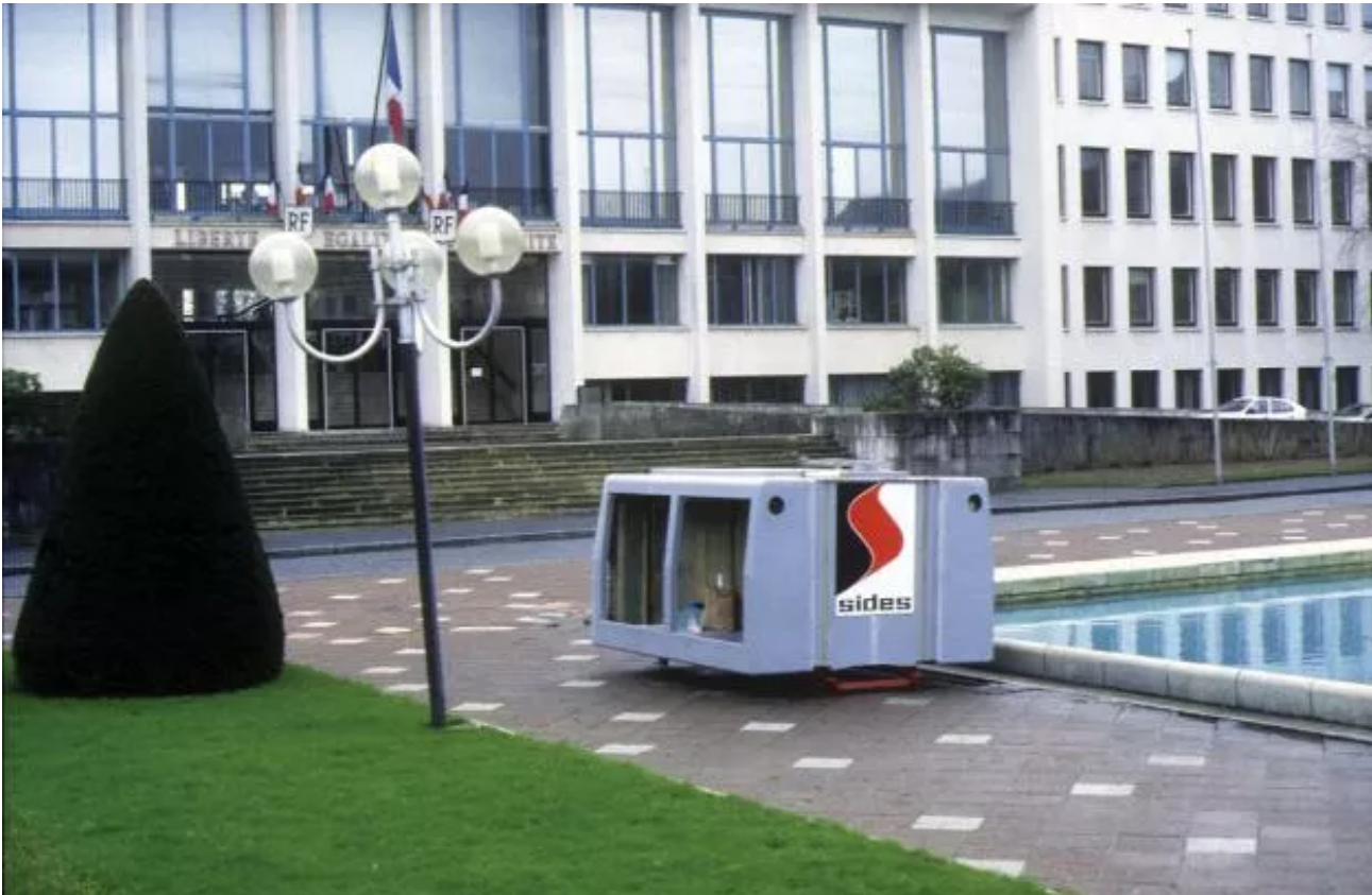
Resin polyester body and cistern for fireman's vehicle lent by Sides, installed in front of the Town hall.