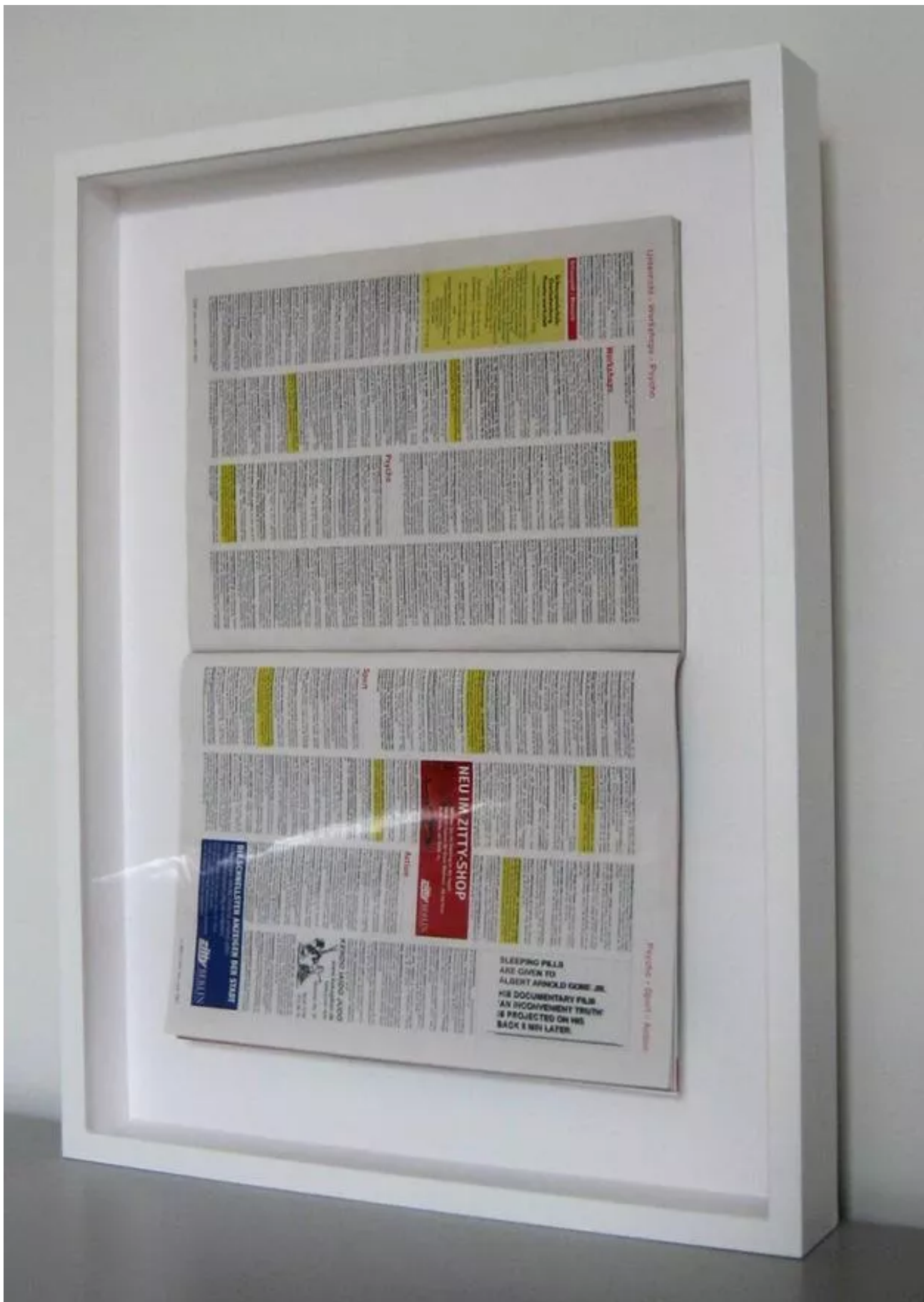
Zitty 7, 27 march – 9 april, 2008 with the advertisement on page 247 in the Psycho-Sport-Action section.